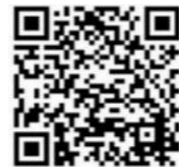
(無料法律相談会スケジュール)

センターでは、「弁護士による無料法律相談会」を実施しています。 弁護士に個々の状態に応じた専門的な相談をしてみませんか？ (Zoom相談も可能)是非、ご活用ください。 今後のスケジュールはホームページをご確認ください。 (ホームページ) https://www.asahikawa-shakyo.or.jp/single/